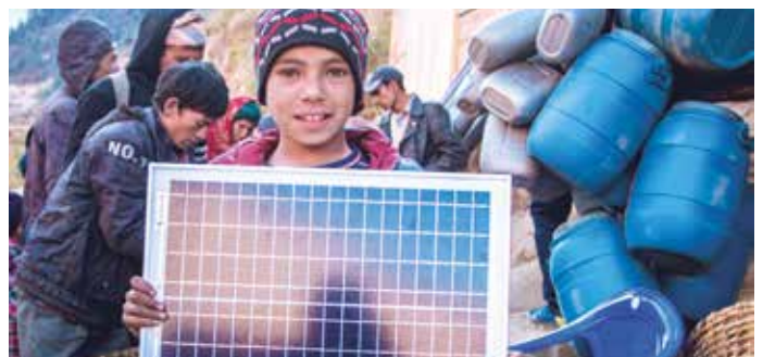
Solarpanels liefern zukünftig Strom.