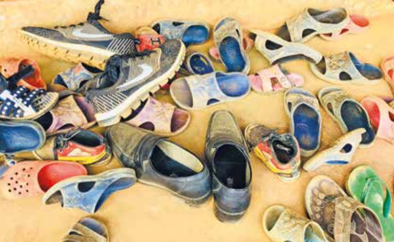
Vor Eintritt ins Klassenzimmer: Schuhe ausziehen!