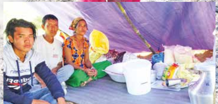
Suche nach unverbrannten Habseligkeiten (Bild oben) – Leben im Notzelt