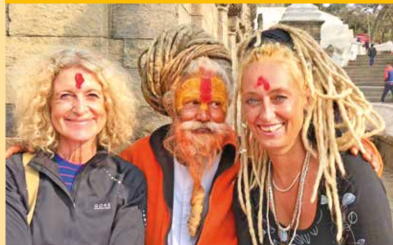
Besuch bei einem Sadhu