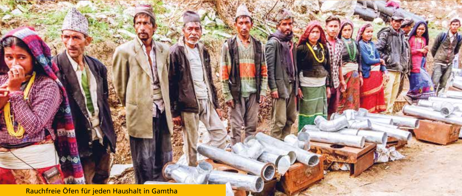
Rauchfreie Öfen für jeden Haushalt in Gamtha