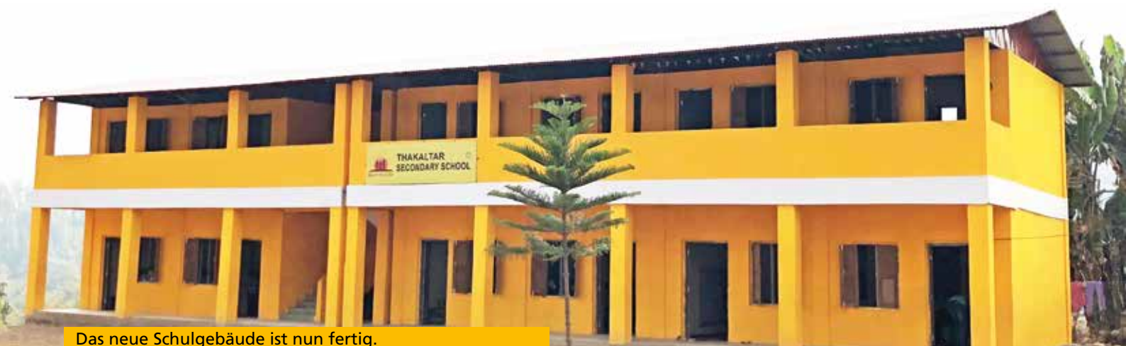
Das neue Schulgebäude ist nun fertig.

Zum Abschluss des Projektbesuchs bringt Stella unseren Gast noch zu einem der zahlreichen Privathaushalte des Dorfes, die von Back to Life mit einem kleinen, aber effektiven Biogasanlagen-System ausgestattet wurden. Dabei werden der Tier-Dung und das Abwasser der Toilette in einen großen unterirdischen Sammelbehälter geleitet, in dem das Gas durch die Lagerung entsteht. Die direkte Leitung des Gases zur Kochstelle im Haus macht die Essenszubereitung fast schon komfortabel – in einem täglichen Leben voller Einschränkungen und Entbehrungen. Als die Idee den Dorfbewohnern damals das erste Mal vorgestellt wurde, lehnten diese sie zunächst kategorisch ab. Zu absurd erschien ihnen die Vorstellung, dass man mit Hilfe von Dung und Fäkalien kochen könne.