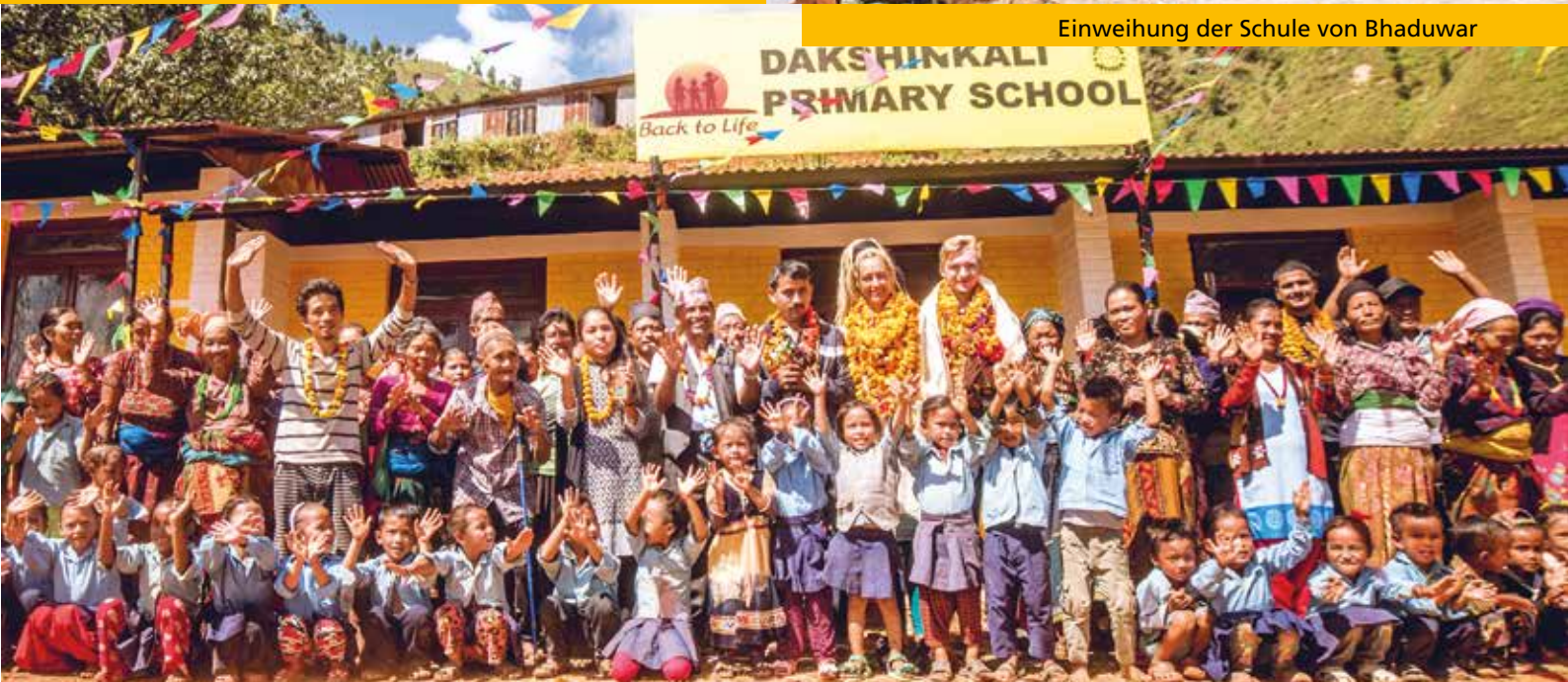
Einweihung der Schule von Bhaduwar