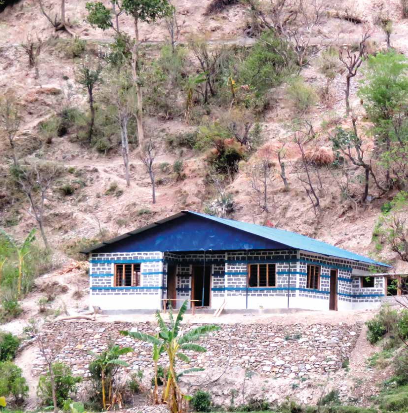
In Hyanglu steht das 7. Geburtshaus von Back to Life kurz vor der Eröffnung.