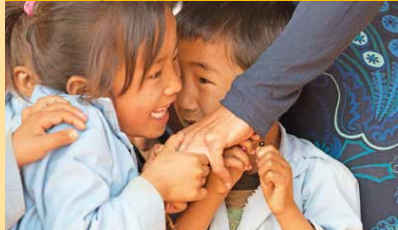
Die Kinder suchen Kontakt.