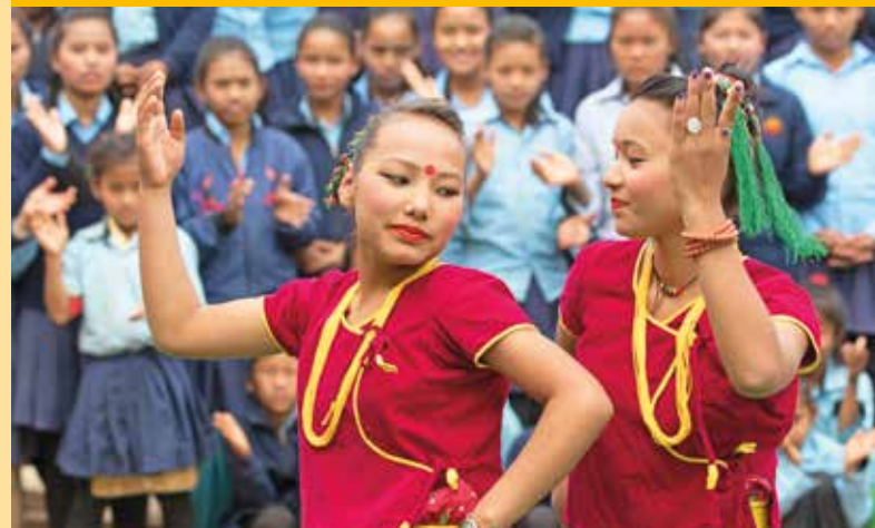
Tänze zu Ehren der Gäste