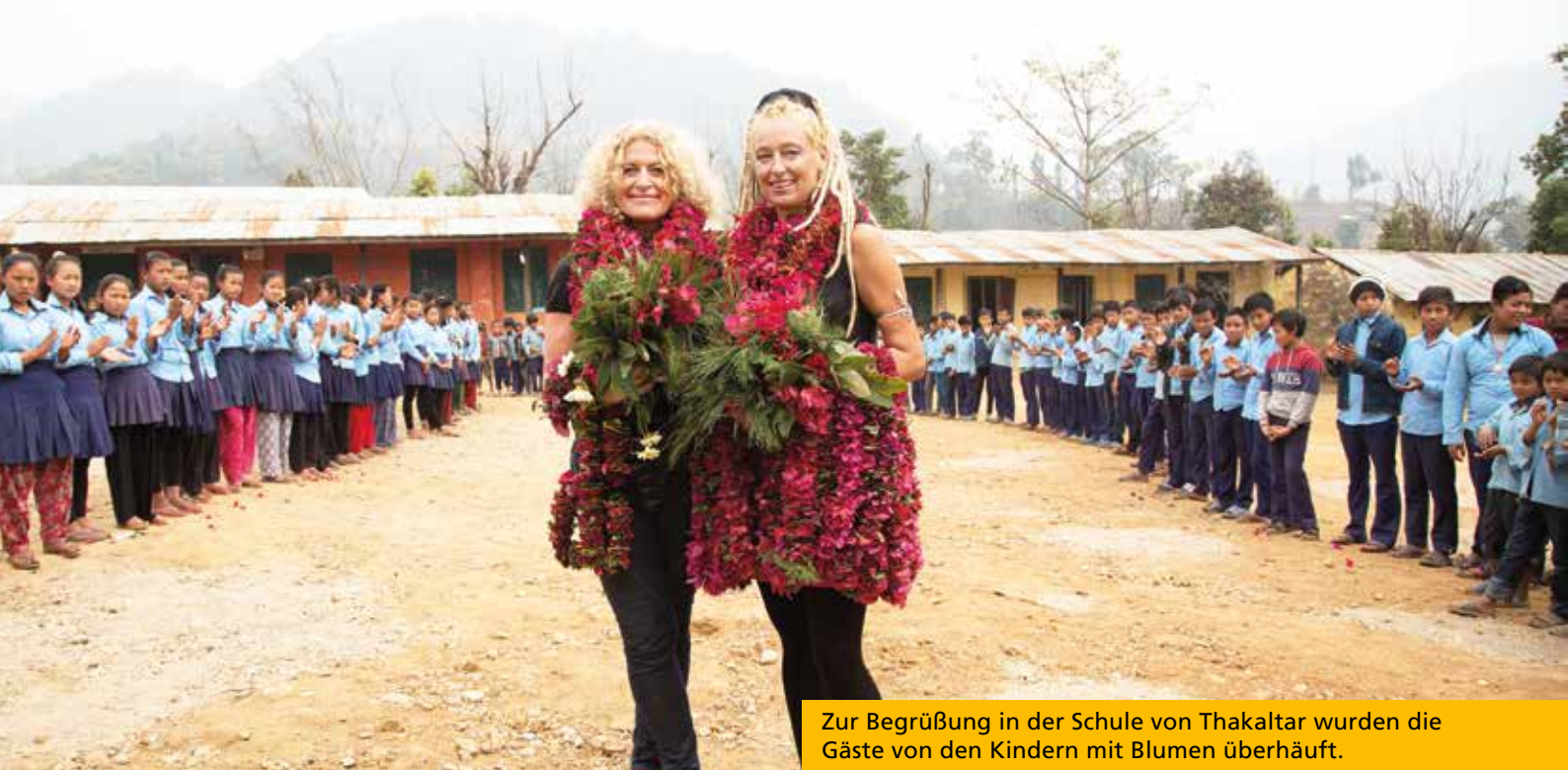
Zur Begrüßung in der Schule von Thakaltar wurden die Gäste von den Kindern mit Blumen überhäuft.

Auch in Thakaltar, eigentlich fernab der damaligen Epizentren, haben die Beben von 2015 ihre Spuren hinterlassen und einige Gebäude stark beschädigt. Unser Neubau des doppelstöckigen Schulgebäudes mit insgesamt 6 Klassenräumen versetzt die Lehranstalt endlich wieder in die Lage, alle Schüler unter zumutbaren Bedingungen zu unterrichten. Ferner wird dadurch dafür gesorgt, dass der Unterricht nun auf die Klassen 9-10 ausgeweitet werden kann: Ein seit langem gehegter Wunsch der Schulleitung, der verhindert, dass ältere Schüler vorzeitig den Weg zu einer anderen, 4 Stunden Fußweg entfernten, weiterführenden Schule antreten müssen. Nicht wenige scheuen diese tägliche Strapaze, was in der Folge schnell das abrupte Ende der Schulausbildung bedeuten kann.