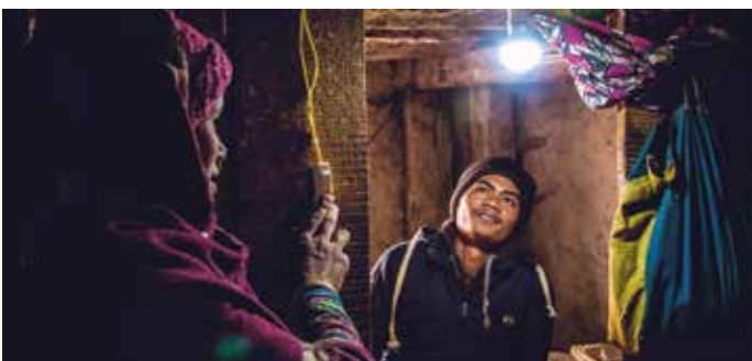
Zum ersten Mal elektrisches Licht im eigenen Haus.

– Bei einem Health Camp in Gamtha konnten 682 Menschen medizinisch versorgt werden, darunter 205 Kinder. Die An- und Abreise der Ärzte und unseres Teams geriet wegen starker Überschwemmungen und schlechtem Wetter zu einer tagelangen und riskanten Odyssee.