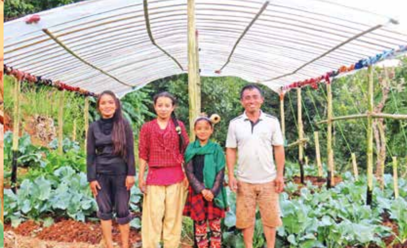
Einfache Gewächshäuser verbessern Ernährung und Einkommen.

Der einzige Weg führt nun über die Serpentin der kleineren Berge und unzählige staubige Lehm-pisten, die ohne Zweifel die Traum-Heimat für jedes Schlagloch der Welt sind, das etwas auf sich hält. Stundenlang werden alle im Jeep durcheinander geschüttelt. Die Straßen sind oft so eng, dass der Gegenverkehr nicht an uns vorbeikommt. Manchmal kommt es dann zum störrischen Kräfte-messen, welcher Fahrer wohl zuerst den Wettstreit um die Vorfahrt aufgibt und schließlich doch zurücksetzt, um den anderen vorbeizulassen.