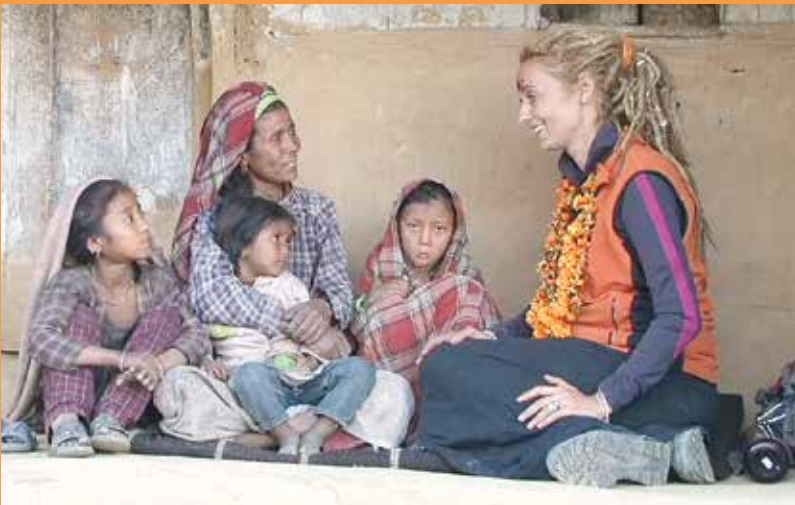
Vor der Abreise wird alles genau besprochen