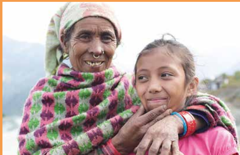
Amma ist stolz auf ihre Tochter