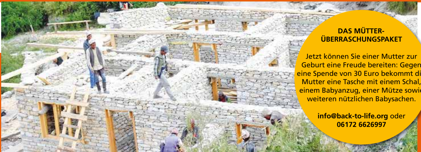
Rowa: Nicht mehr lange und das Dach kann montiert werden