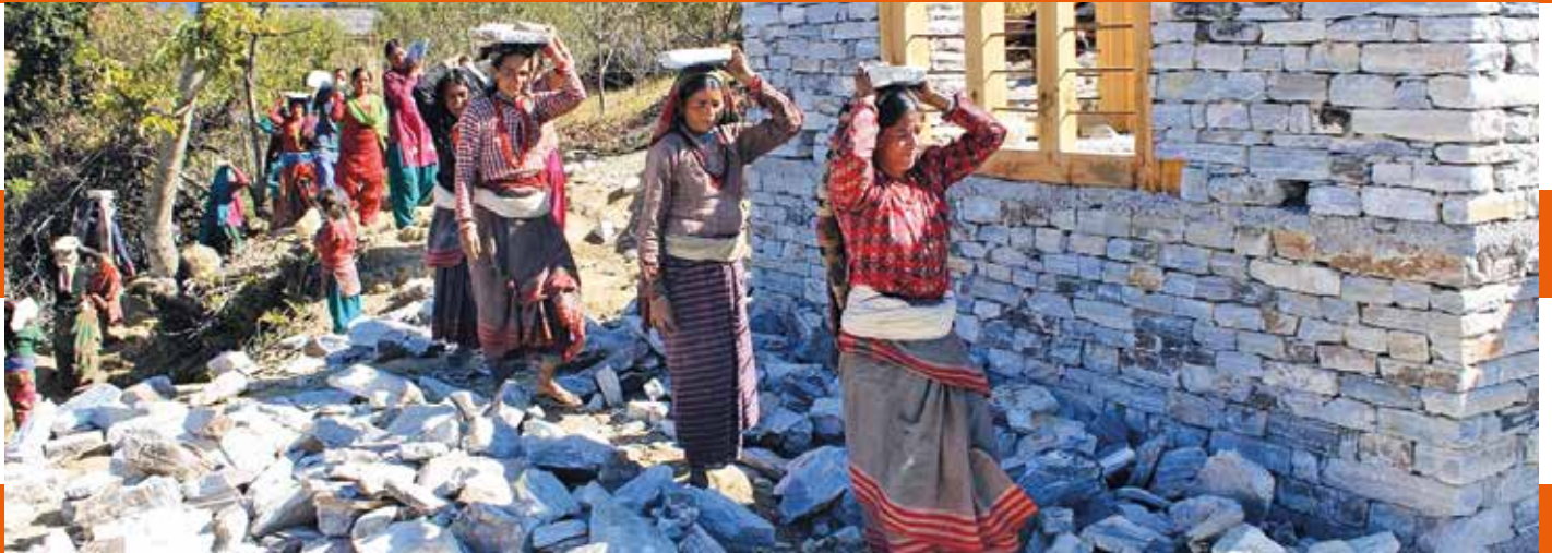
Juika: Jeder Stein wird per Hand transportiert, bearbeitet und gesetzt