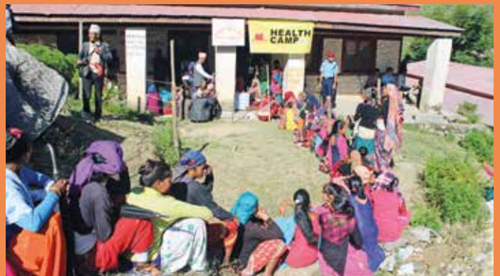
Schon früh am Morgen kommen die Patienten

bis uns glücklicherweise die Nachricht von der Genesung der Frau erreicht.