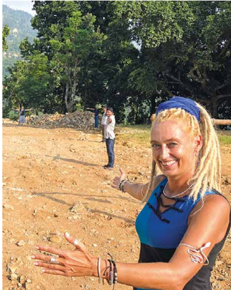
Hier entsteht bald das neue Schulgebäude von Thakaltar