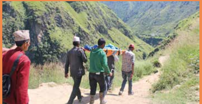
Abtransport ins Krankenhaus