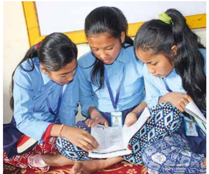
Bücher bilden Gesprächsstoff

In jedem Fall wird unser Programm dazu beitragen die Alphabetisierungsrate in Mugu beständig zu erhöhen. Ein wichtiges Ziel. Genauso wie die Schulabbruchsquote weiter zu senken. Denn dann bleiben die Mädchen zunehmend länger an den Schulen, werden immer seltener als Kinder verheiratet und Schwangerschaften Minderjähriger werden eher der Vergangenheit angehören. Ein Buch kann also viel bewirken, wenn es in die richtigen Hände fällt.