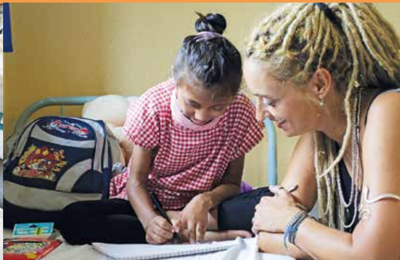
Gemeinsames Lesen, Lernen, Basteln