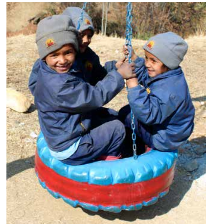
Hier dürfen sie Kinder sein.

SICHER IST SICHER | Ein Spielplatz sollte immer ein sicherer Ort zum Spielen sein. Deshalb steht bei unserem Einsatz dafür immer die Sicherheit an erster Stelle. Wir umzäunen dort, wo die Umgebung gefährlich werden kann, wir lassen Spielgeräte wie Schaukeln, Wippen, Rutschen und Kletterobjekte nicht nur möglichst aus heimischen Materialien fertigen, sondern auch so, dass die Kinder sich keine Splitter holen oder anderweitig verletzen können.