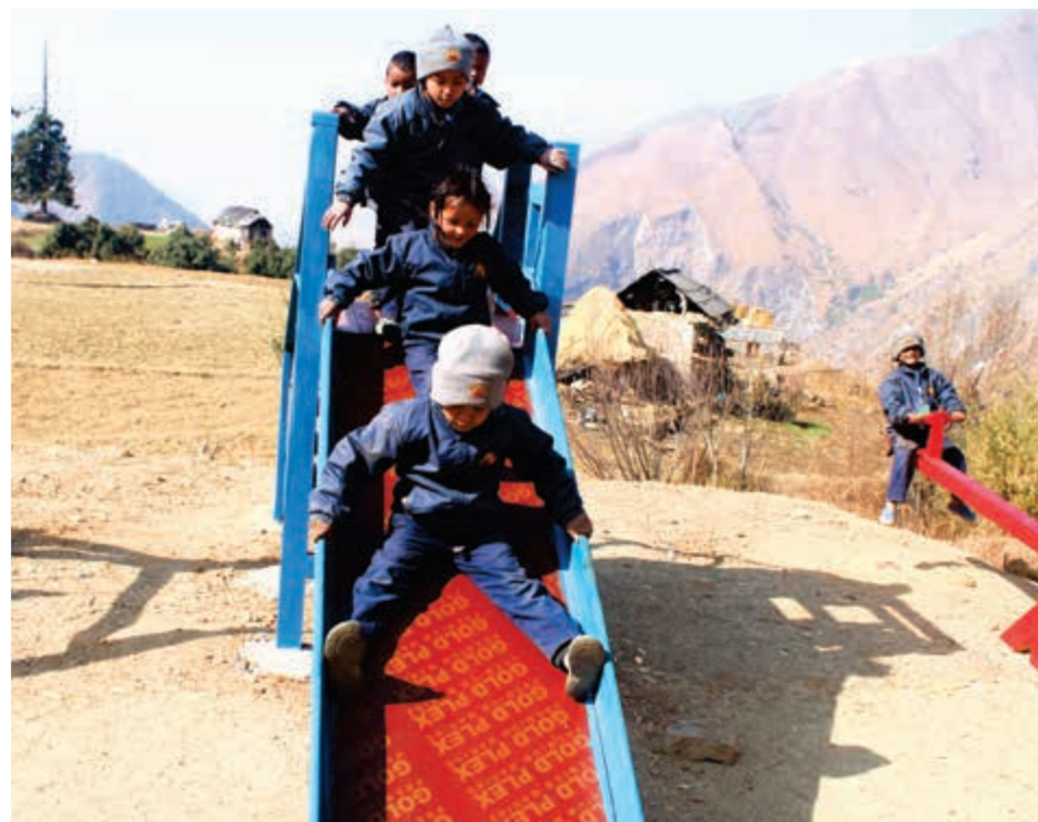
Der Spielplatz ist bunt und einladend und in dieser Gegend einzigartig.