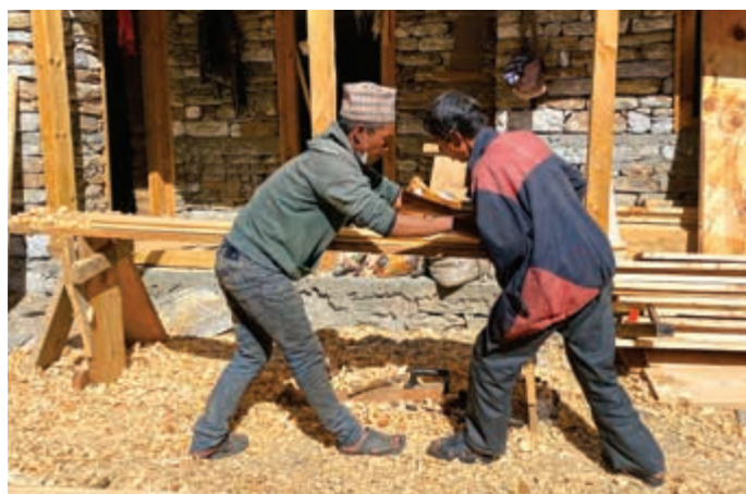
Nur noch wenige letzte Arbeiten stehen aus. Die Hebammen sind bereits vor Ort und haben mit ihrer Arbeit begonnen.

sorgen Tag und Nacht für sichere Geburten und senken die hohe Müttersterblichkeit in den Bergen.