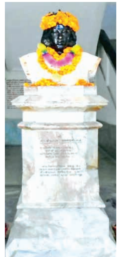
Indra Devis Büste wird auch heute noch mit Blumen geschmückt

Back to Life hat sich daher in den letzten 10 Jahren intensiv damit befasst, die Zahl der Geburtshäuser in der abgelegenen Bergregion Mugu zu erhöhen. In diesem Jahr werden wir das 15. Geburtshaus eröffnen können. Alle von ihnen sind adäquat gemäß den staatlichen Vorgaben mit qualifiziertem Personal und medizinischem Equipment ausgestattet. Schon während der Schwangerschaft werden die Mütter dort intensiv betreut und absolvieren mindestens die vier von der Weltgesundheitsorganisation empfohlenen Vorsorgeuntersuchungen. Rechtzeitig vor der Geburt begeben sich die Mütter in die Obhut der Hebammen und bringen ihr Kind sicher und geborgen im Geburtshaus auf die Welt. Davon haben bis heute schon über 1940 Kinder und ihre Familien profitiert.