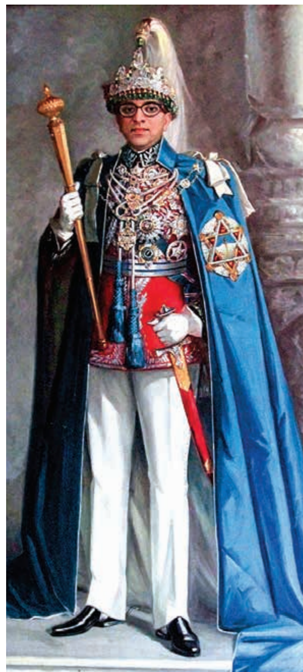
König Mahendra Bir Bikram Shah Dev heiratete 2 Jahre nach Indras Tod ihre jüngere Schwester Ratna. Aber nur unter der Bedingung, dass das Königspaar kinderlos bliebe. Drei Thronfolger waren ja bereits geboren. Ratna erklärte sich damit einverstanden.