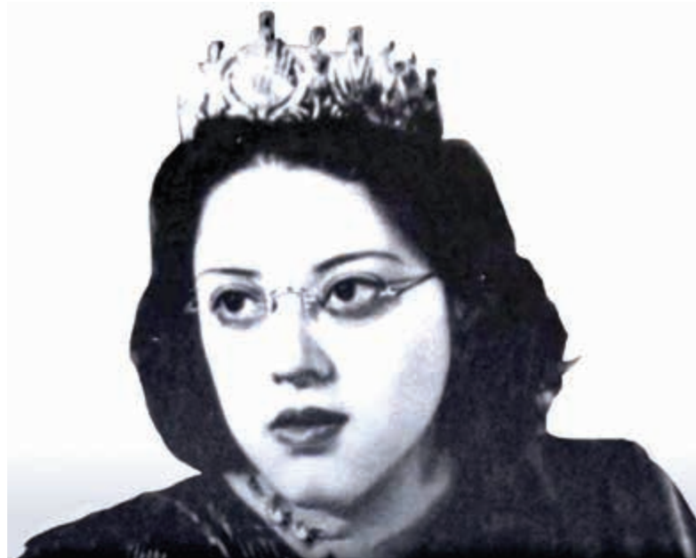
Indra Rajya Lakshmi Devi