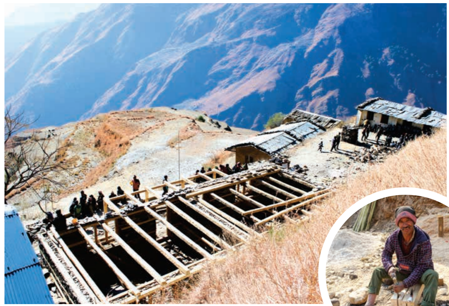
Beim Bau der Ratapani Schule

hat Back to Life in Nepal bisher einschließlich der neuen Gebäude in Dumana und Ratapani gebaut.