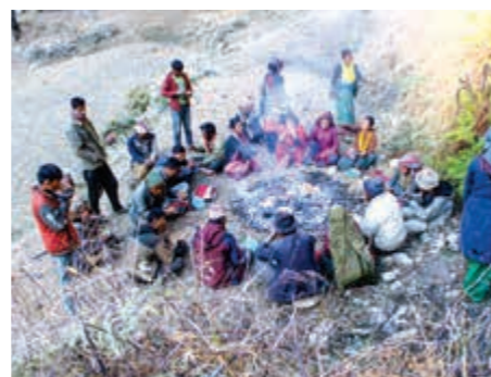
Die Frauen und Männer machen eine kurze Pause und wärmen Roti (Fladenbrot) auf, das von Zuhause mitgebracht wurde.