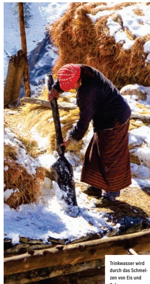
Trinkwasser wird durch das Schmelzen von Eis und Schnee gewonnen. Das verbraucht viel Energie und ist nicht sauber.

Die Menschen im Hochgebirge haben gelernt, mit den Herausforderungen des Winters