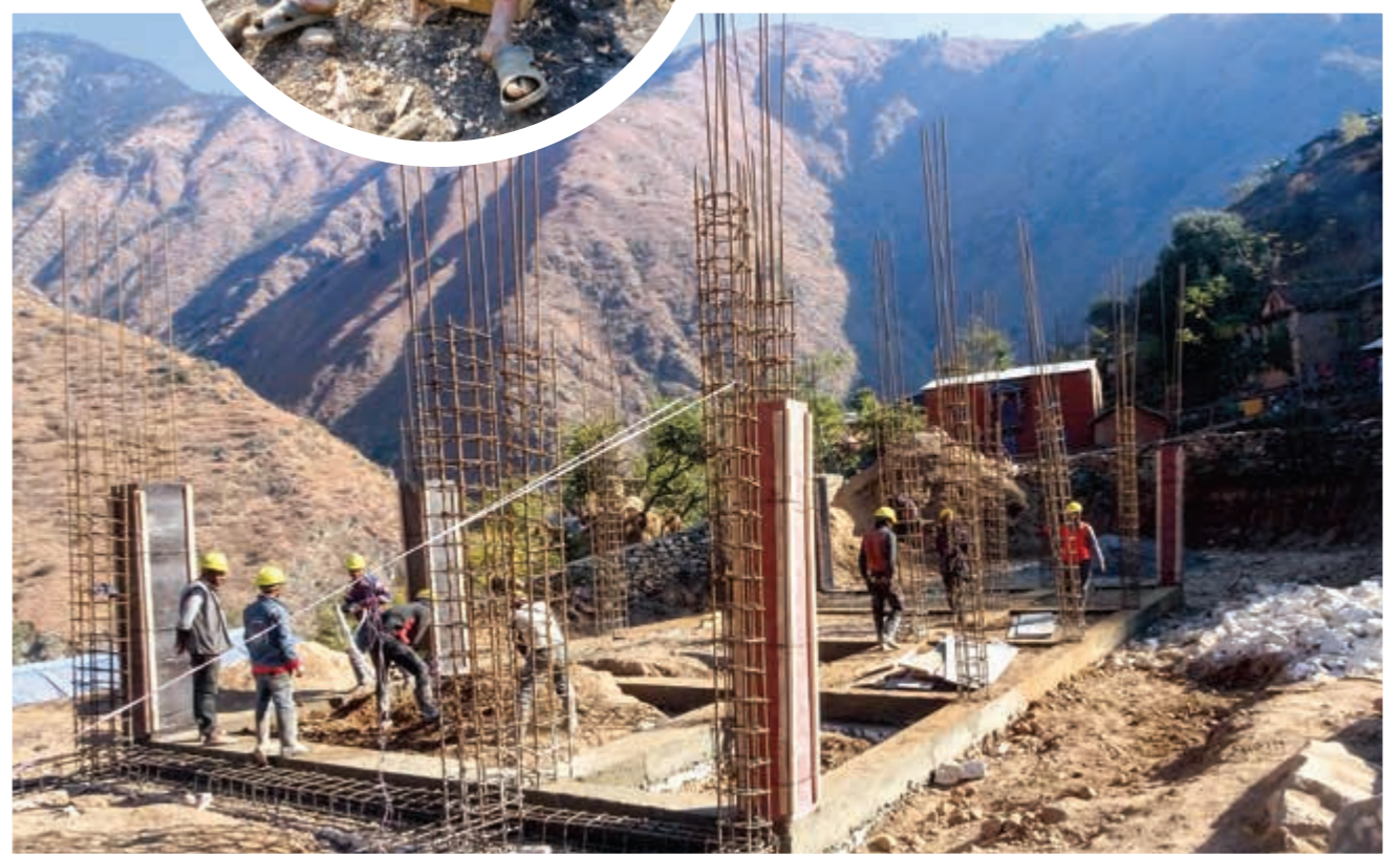
Für die große Schule mit acht Räumen haben wir uns zu einer modernen Stahlbetonbauweise mit Steinmauerwerk entschieden.