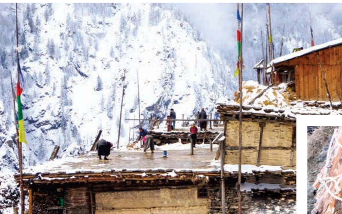
Manche Dörfer sind während des Winters monatelang von der Außenwelt abgeschnitten.