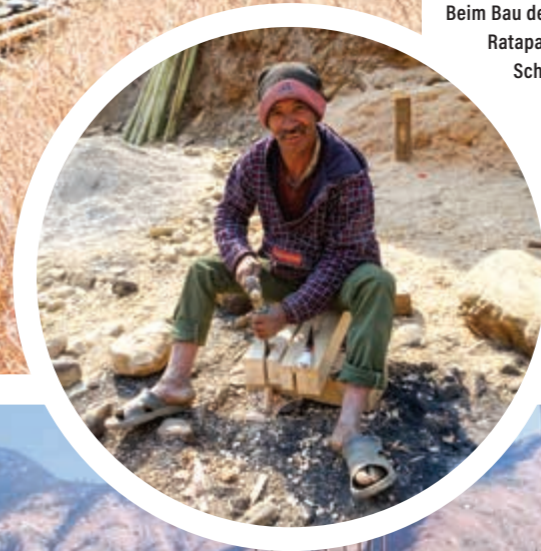
Beim Bau der Ratapani Schule

Wir gehen davon aus, dass die neuen Räume im Juni fertig sind und die Schülerinnen und Schüler hier dann eine deutlich bessere Lernumgebung nutzen können, die sie fördert und zu guten Lernerfolgen verhilft.